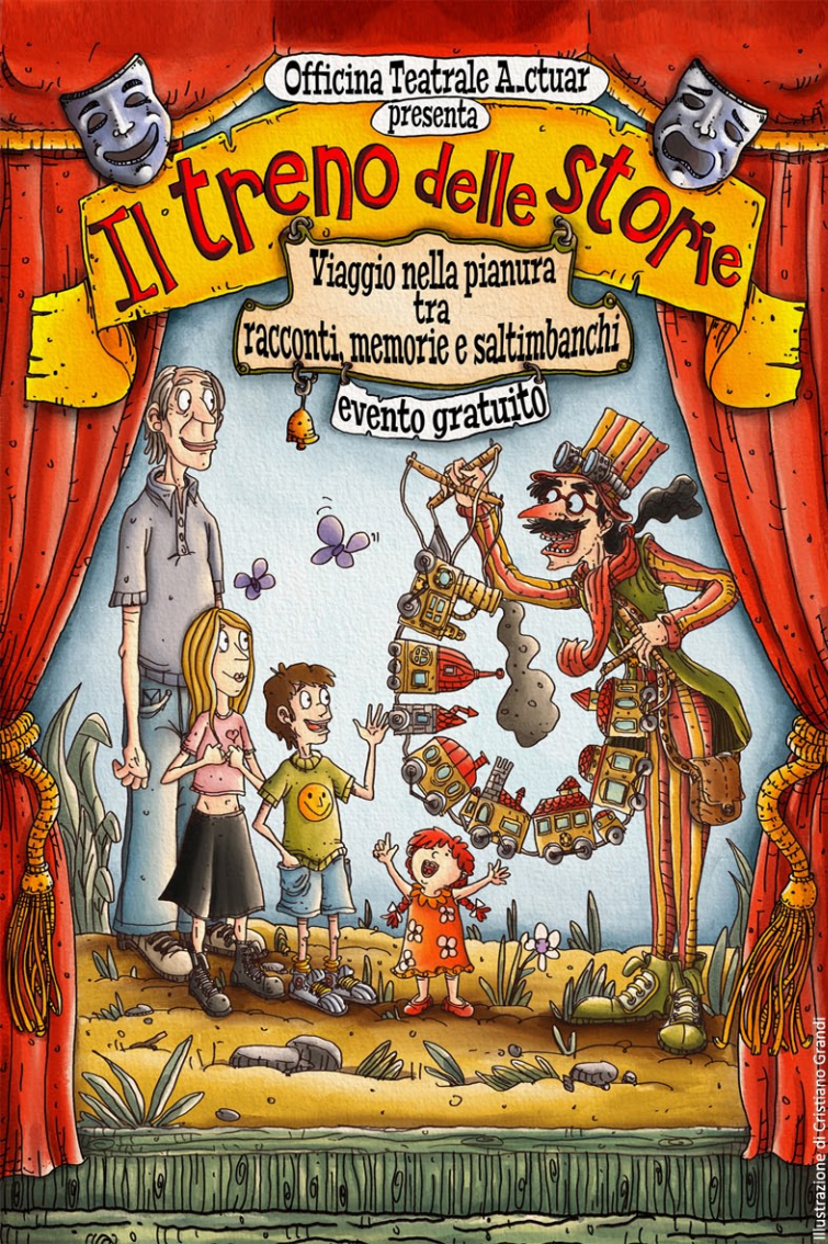
Illustrazione di Cristiano Grandi